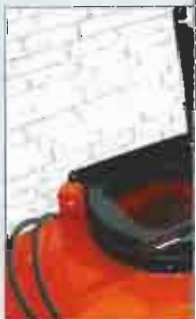
Das Auswurfrohr ohne Werkzeug und gewährleitet den Zugang zum Innenraum (Inspektion etc.).