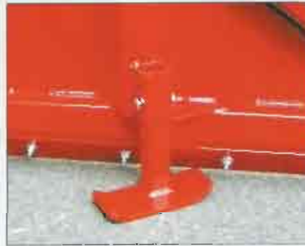
Die Schleppschuhe sind höhenverstellbar und die Verschleißleiste hat 2 Verschleißseiten.