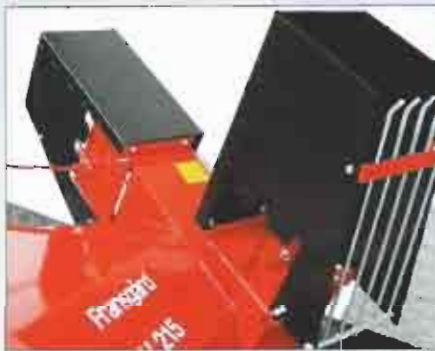
Typ V-215 mit 2 Auswurfrohren und mechanischer Rohrklappe.