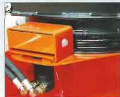
Auswurfrohr 360° drehbar, für optimale Schneedosierung. (Modell V-215 ausgenommen).