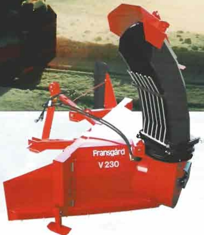
V-215 / V-230