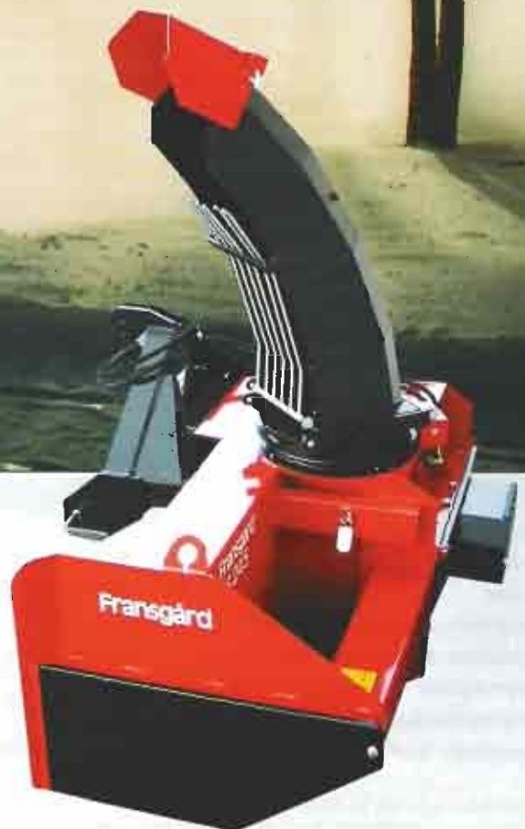
S-220 / S-245 / S-245 proff