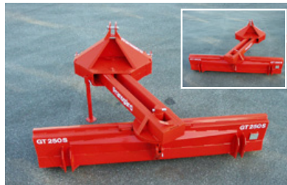
seitliche Verstellung (ohne Werkzeug)